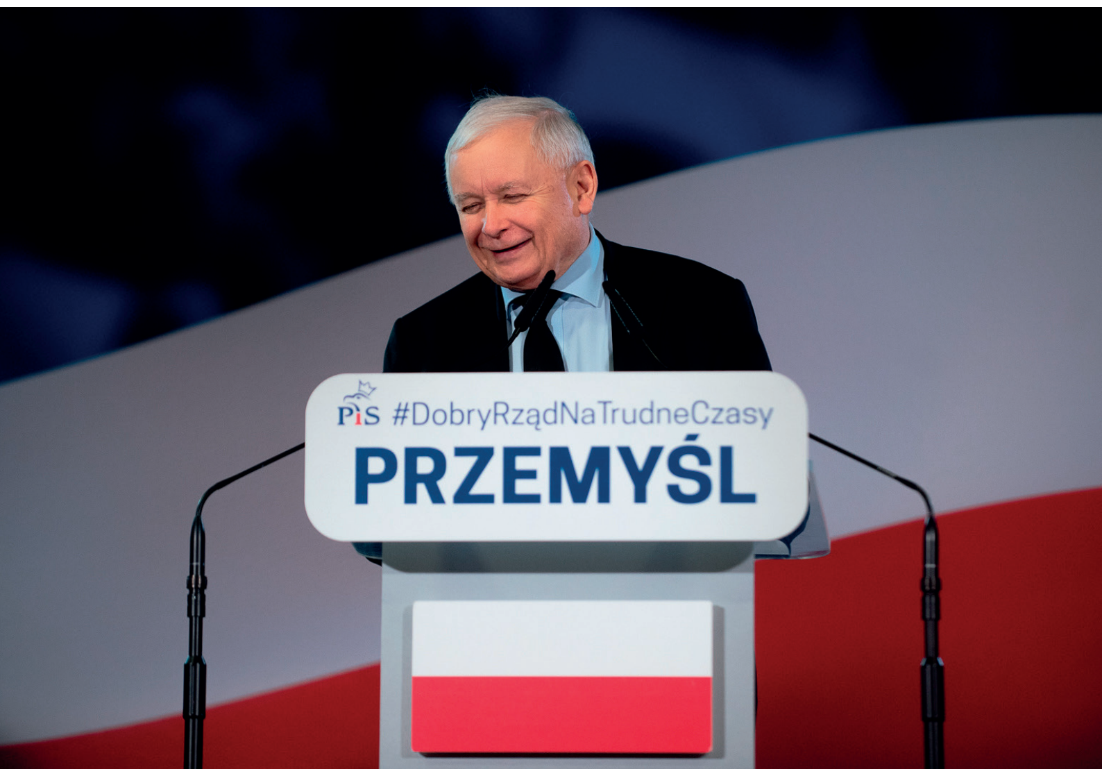
Prezes PiS Jarosław Kaczyński w Przemyślu