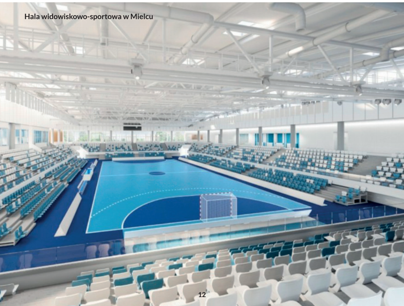
Hala widowiskowo-sportowa w Mielcu