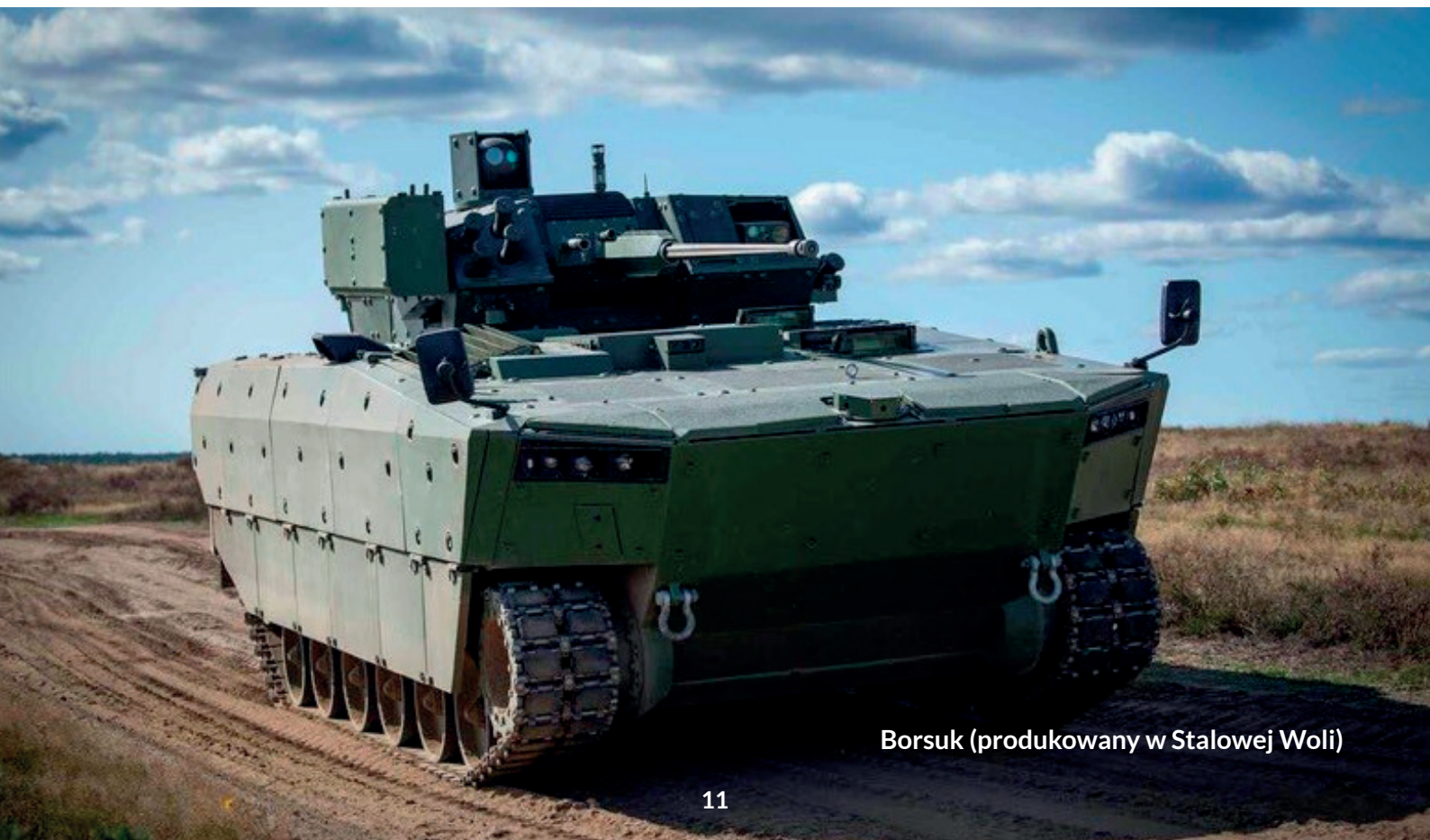
Borsuk (produkowany w Stalowej Woli)